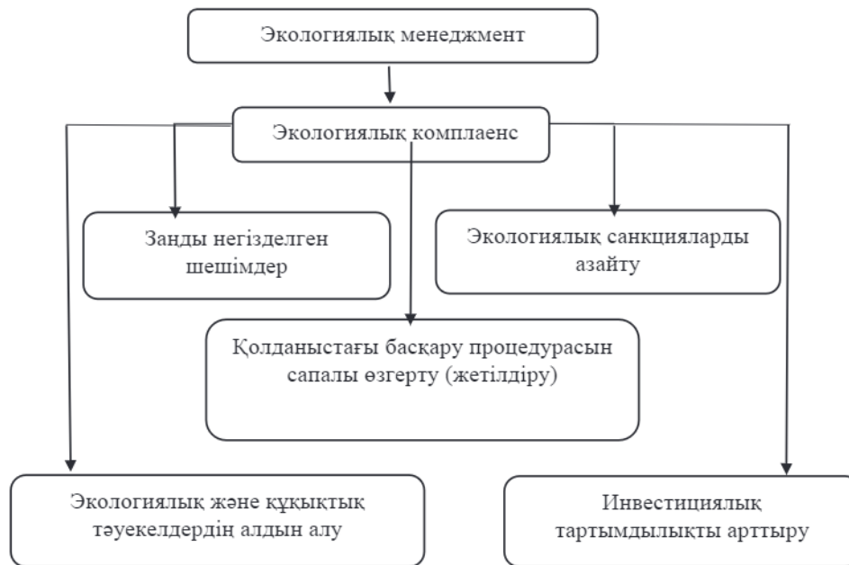
Сурет 4 – Экологиялық комплаенсты қолданудағы артықшылықтар

Ескерту: [8] дереккөз негізінде авторлармен құрастырылған.