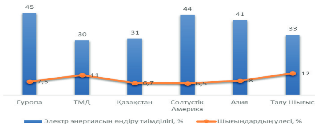
Сурет 2 – Электр энергиясын өндіру және тарату тиімділігі (2022 ж.)

Энергетикалық жабдықтың басым бөлігі – 65%, 20 жылдан астам жұмыс істейді, оның ішінде шамамен – 31%, 30 жылдан астам пайдаланылған. Энергия өндіруші жабдықтар мен желінің тозуы сәйкесінше 70% және 65% құрайды. Осылайша, 2022 жылғы жағдай бойынша электр энергиясын жеткізу және таратудың жалпы жүйелері бойынша электр энергиясын жеткізудегі ысыраптар 6,7% құрайды (2-сурет).